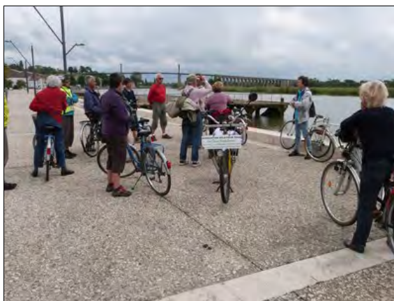
Le pont de Tonnay-Charente

La route d'approche du dernier pont, le Transbordeur, est ponctuée d'arrêts afin d'admirer l'un des 350 nids charentais de cigognes, le vol d'un héron pourpré, des vaches paissant dans les prés... Elle longe l'usine de traitement des eaux Lucien Grand et emprunte la route du Tonkin, un chemin blanc ponctué d'un petit raidillon. À l'ombre d'un frêne, au pied du musée du Transbordeur, le goûter de galettes de Beurley et de jus de fruit produits localement est offert aux 17 cyclistes.