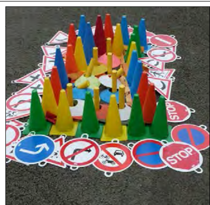
Pour ne pas tomber dans le panneau !