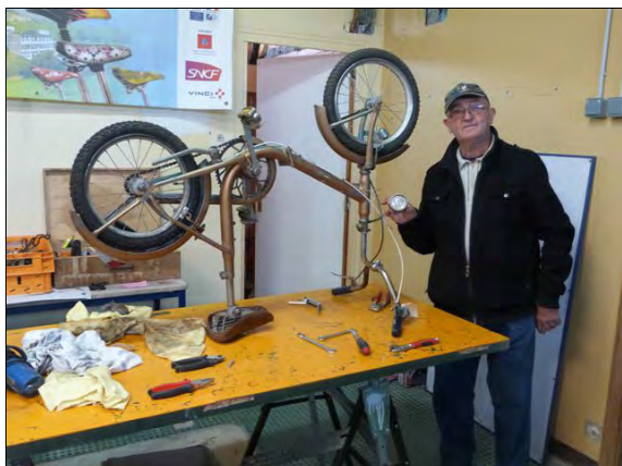
Des permanences studieuses...

Chaque mardi de 14 h 00 à 16 h 00, ( hors vacances ) aux Fourriers quelques bénévoles occupent l'atelier. On démonte, on répare, on récupère des pièces, on recycle. Avec deux vélos, on en fait un. En clair, une seconde vie à la bicyclette, et une chance pour une personne en mal de mobilité.