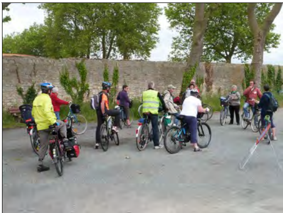
Au port de plaisance

Lors de la fête de la Nature qui a eu lieu du 21 au 25 mai 2014, en partenariat avec la LPO, nous avons encadré une sortie vélo « La route des ponts ». Rendez-vous était pris le dimanche 25 mai à 14 h 00 à l'Espace Nature, rue Audry de Puyravault.