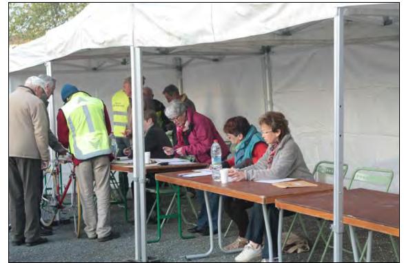
Les bénévoles en action !

Cette 2 e bourse aux vélos s'est déroulée le samedi 12 avril. L'emplacement et le soleil ont permis à cette journée d'être une belle réussite en nombre de vélos déposés (100), et de vélos vendus (68). De nombreux curieux se sont arrêtés et ont déambulé à l'intérieur du parc. Une belle vitrine pour l'association.