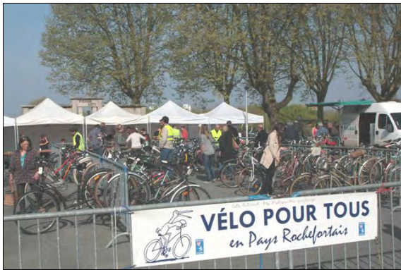
Une bourse bien garnie...