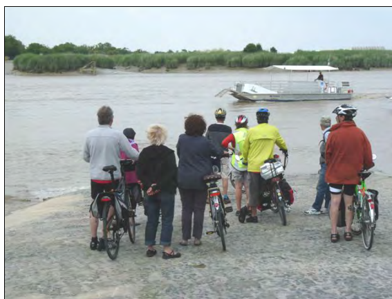
Trop tard, il est parti...

instant plus tard, après avoir pris une dernière collation à l'ombre d'un frêne au pont transbordeur, il est hélas, temps pour les membres de « Vélo pour tous » de se séparer non sans promettre de se retrouver.