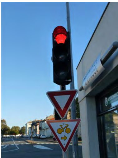
En toute sécurité...

C'était une demande récurrente de notre association (voir bulletin 16 de juin 2011, pages 6 et 7) : autoriser les cyclistes à tourner à droite à certains feux tricolores quand ce déplacement ne présentait aucun danger pour les usagers de la route. Pour cela, la prise d'un arrêté municipal et la pose d'un panneau étaient nécessaires. C'est ce qui vient d'être fait Place Piquemouche, au carrefour de la rue du 14 juillet vers l'Avenue des Déportés et Fusillés.