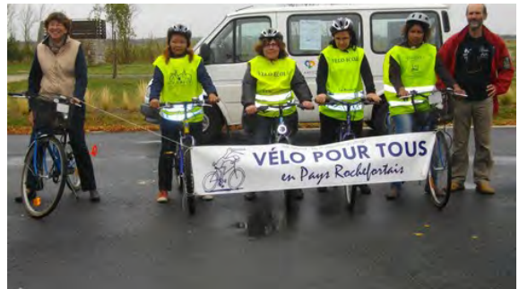
Un groupe très motivé !

Le 4 octobre , cinq stagiaires de l'association AAPIQ ont débuté les cours d'apprentissage vélo. Quatre d'entre elles ce jour là ne savaient pas du tout faire du vélo . Cette première journée c'est évolution « sans pédales », autrement dit faire de la patinette...comme les enfants.