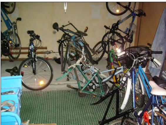
Y a encore du boulot...

En début d'année 2011, l'association avait transmis un courrier à Monsieur le Commissaire de Police afin de pouvoir récupérer les vélos non restitués.