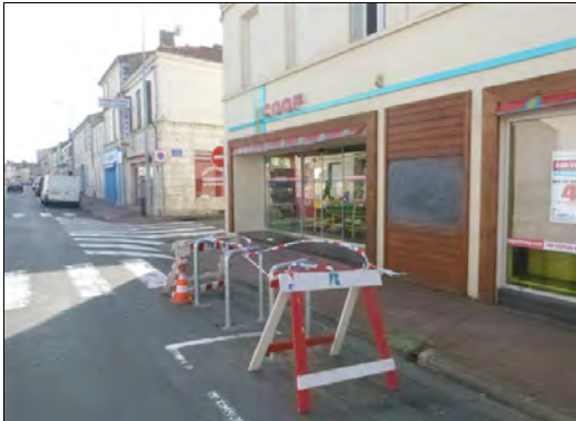
Les nouveaux arceaux rue Gambetta Rochefort

Depuis la rentrée des aménagements sont réalisés -voies réservées pour les cyclistes, pose d'arceaux-. Utilisez les ! Les arceaux vous permettent d'attacher votre vélo à un point fixe, évitez les panneaux de signalisation ce qui peut occasionner une gêne pour les piétons.