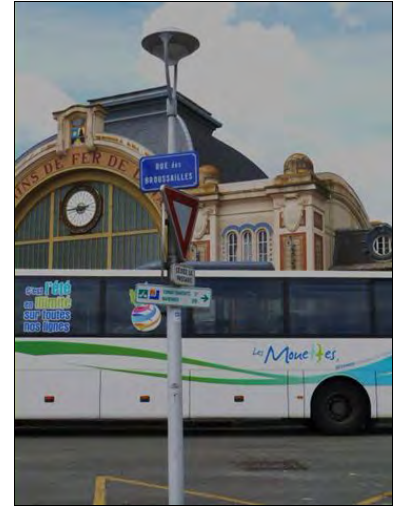
Devant la gare SNCF

À ce niveau il serait judicieux d'annoncer la direction du Pont transbordeur.