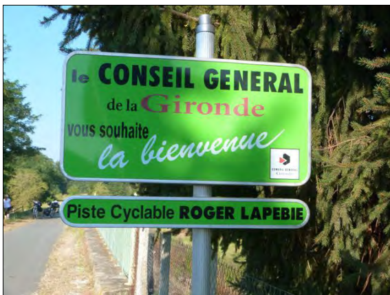
Début du jeu de piste...

Après quelques km nous engageons sur la piste Roger Lapébie -ancien vainqueur du Tour de France-. Ce parcours, ancienne voie ferrée, reliait Sauveterre -de-Guyenne à Bordeaux.