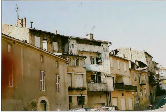
Les tristes façades de La Réole

Il nous reste un quinzaine de km effectuée sous une chaleur écrasante, car pas d'ombre. Contents d'arriver à la Réole par le quai longeant la Garonne. Le premier bistrot trouvé, on s'arrête.