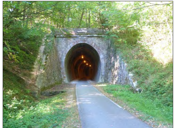
Sur le parcours

Nous partons il est 10h00, juste après des hollandais qui, eux, avaient une étape de 100 km.