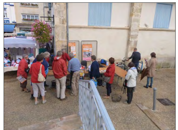
Dans notre coin, à Fouras