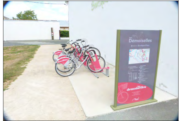
Devant la boutique R'bus

Les jours et les horaires sont différents selon les stations, ainsi que la mise à disposition sur l'année.