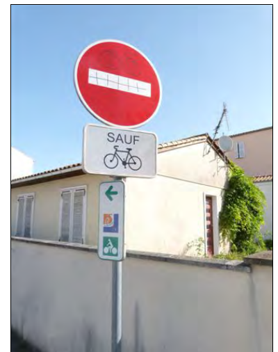
Rue Cavelier de la Salle

Longer le quai Tahiti et filer vers l'avenue Marcel Dassault en traversant le parking.