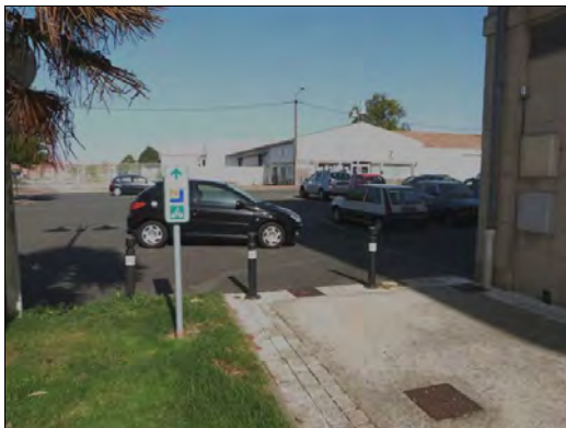
Sortie du quai Tahiti

De plus, pour qui descend du train, aucune direction, ou alors il faut chercher ou demander son chemin.