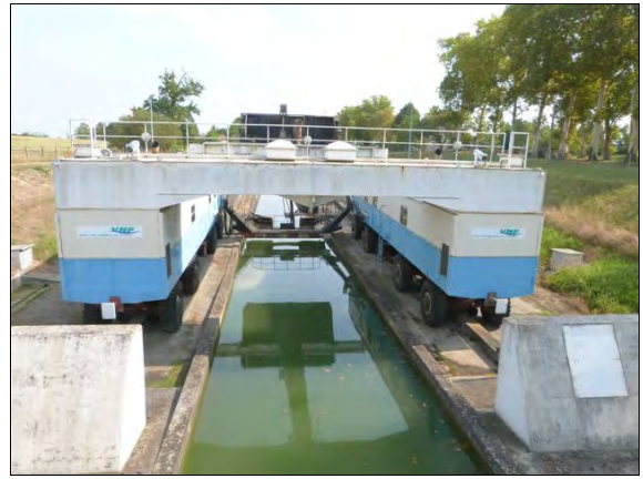
La pente d'eau de Montech

Les derniers kilomètres ne sont pas les plus faciles.... dans la tête. Le temps est maussade. La signalisation pour se rendre à la gare de Toulouse -l'hôtel pour la nuit est à proximité- on n'a pas su la trouver. C'est un peu la galère.