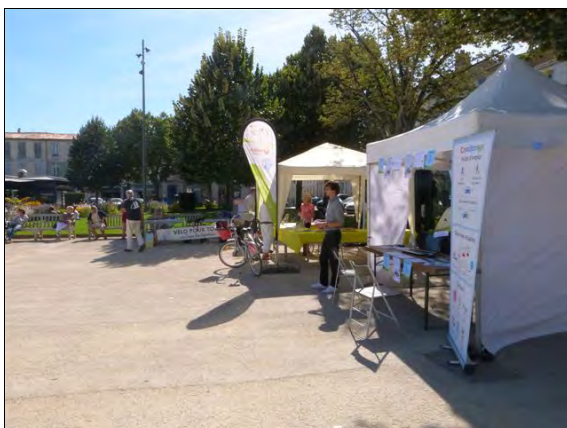
Place Colbert à Rochefort