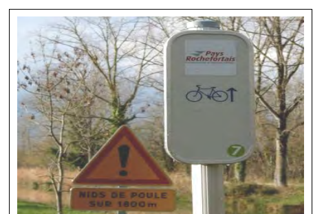
Nids de poule pour pigeons ?