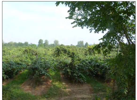
Les champs d'arbres à kiwis

Damazan revit le lundi. Une chance car il faut faire les courses pour le déjeuner. Quelques rares haltes nautiques comme Buzet. Parcours un peu ennuyeux heureusement bordé successivement de pommeraies, de champs de tabac, de maïs, d'arbres à kiwis, de peupleraies .