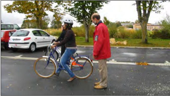
Sous l'œil attentif de Philippe