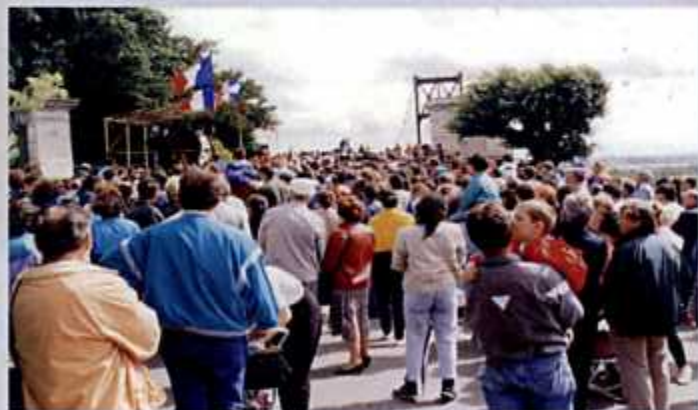
Fête des 150 ans du pont