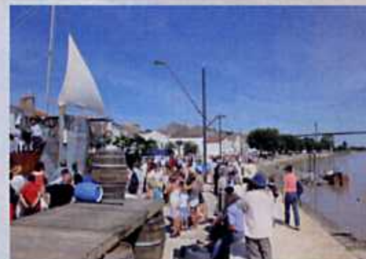
2014 - Fête du canon de l'Hermione